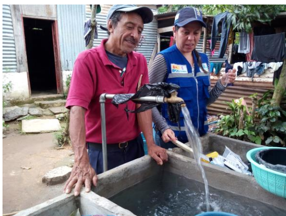
Fotografía 1: Certificación sistema de Agua Potable, Aldea el Paraíso, Municipio del Quetzal, San Marcos.