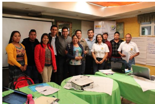
Fotografía 4: Capacitación a actores claves del programa FCAS MANCUERNA en la implementación del software sobre sistemas de seguimiento municipal.