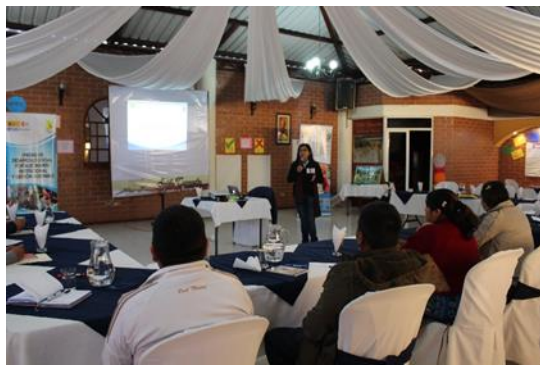
Fotografía 3: Fortalecimiento de capacidades a integrantes de los departamentos de agua potable y saneamiento para uso de materiales de sensibilización.