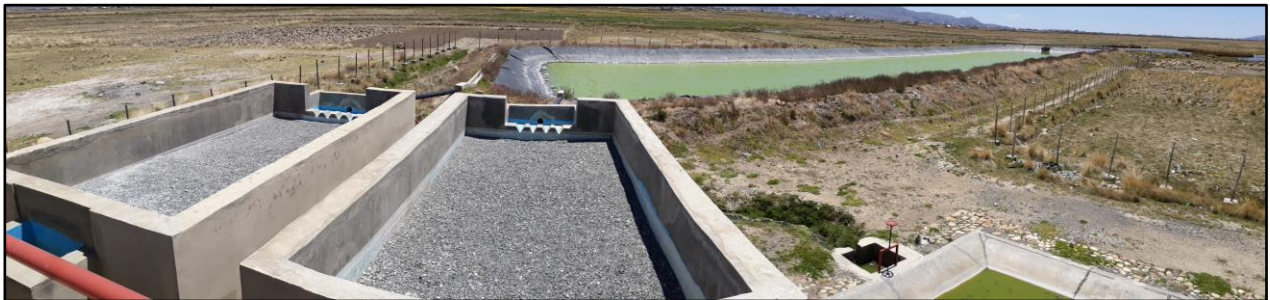
Vista general de los filtros anaerobios y laguna. AS Warisata