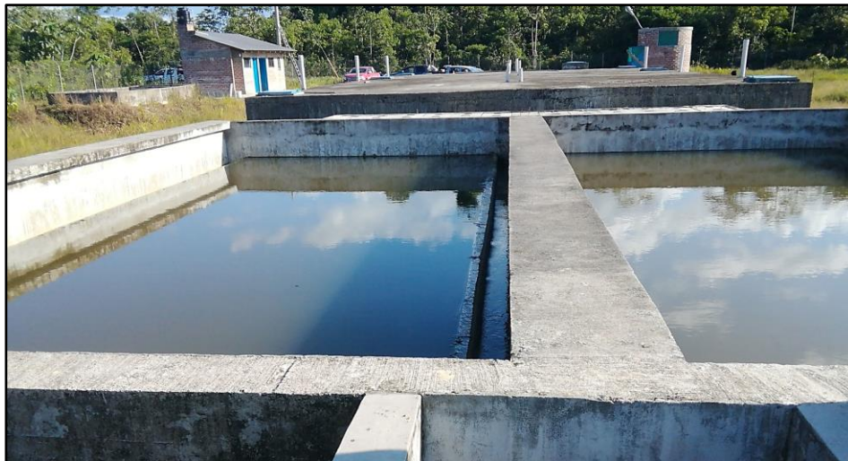
Vista general. PTAR Mariposas