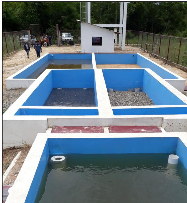
Filtros de grava y filtros lentos de arena. PTAP San Gabriel.