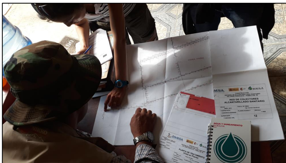
Revisión de red de colectores. AS Linde Paracaya.